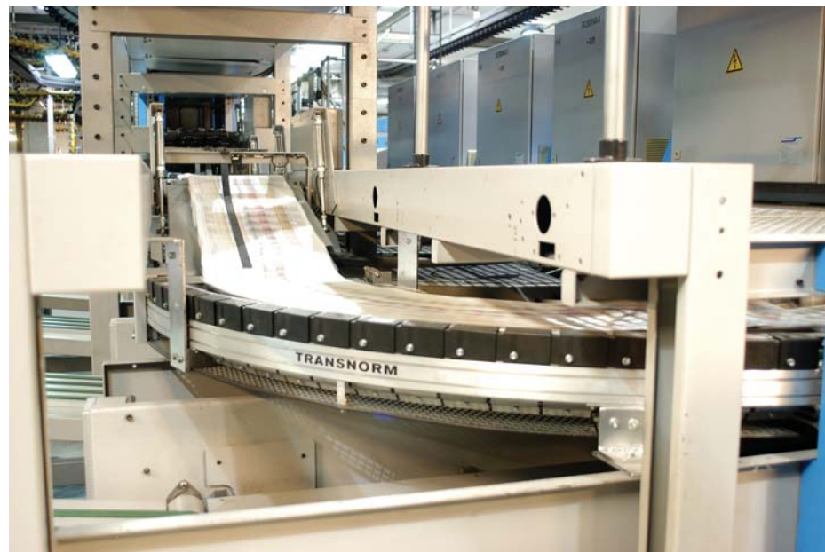
Curvas de banda