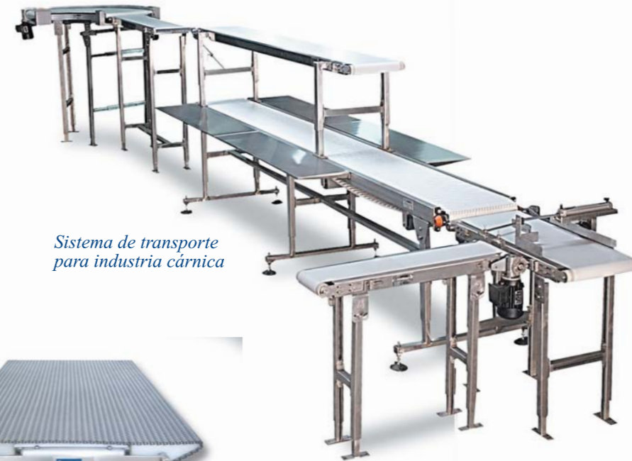
Sistema de transporte para industria cárnica