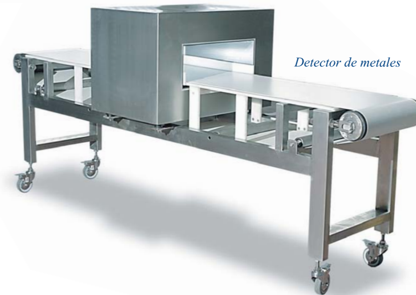
Detector de metales