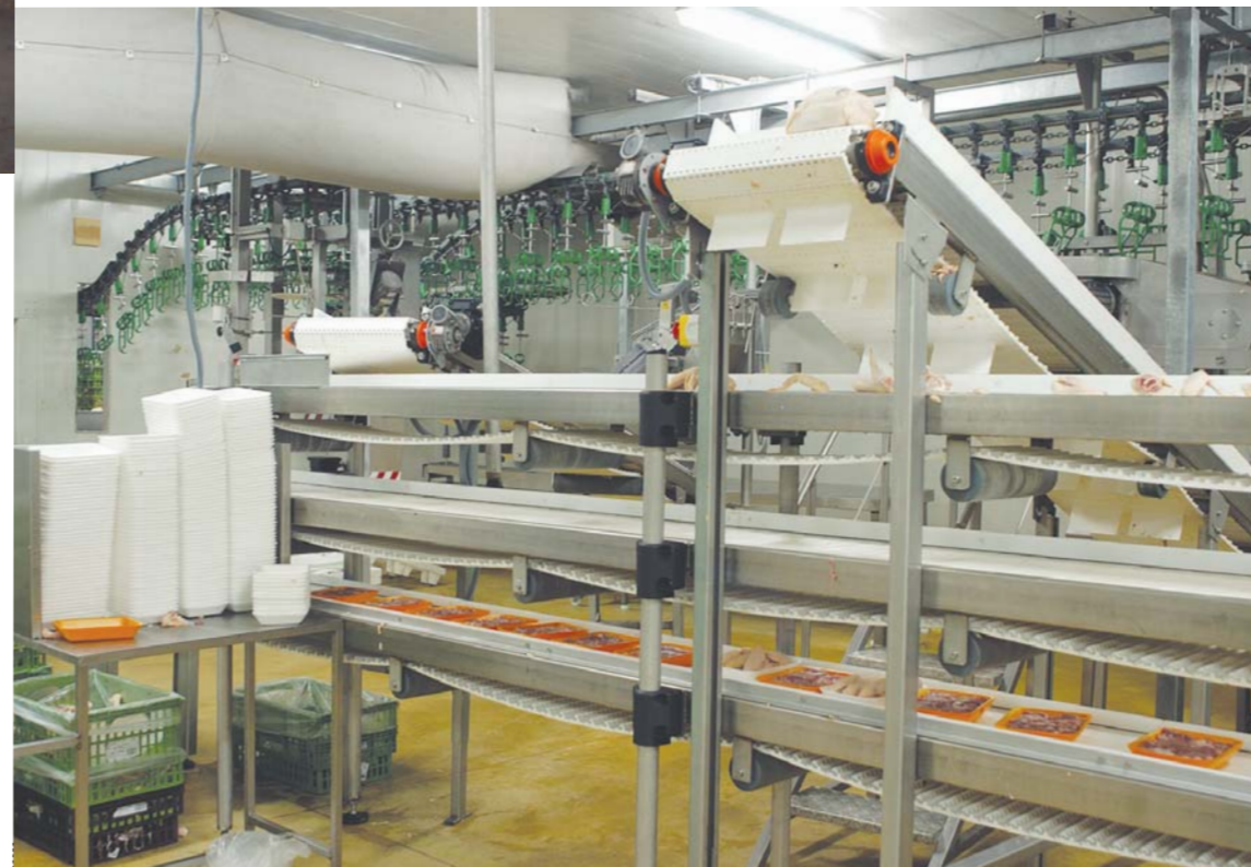
Conjunto de transportadores de banda modular para despiece de aves