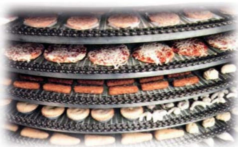
Transportadores en espiral