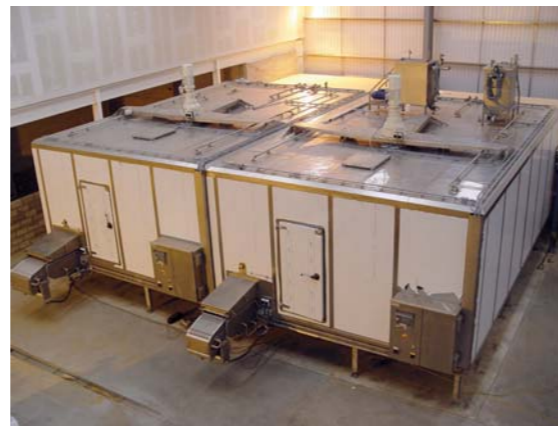
Túneles de congelación