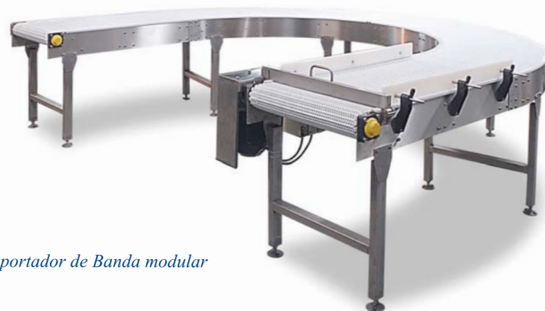
Transportador de Banda modular