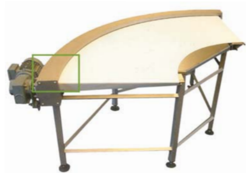
Curvas de banda en "canto-cuchilla"